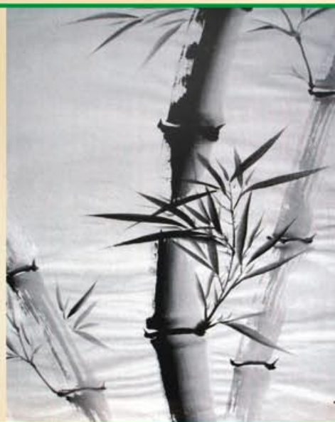
Ilustração: Morgan Kaus